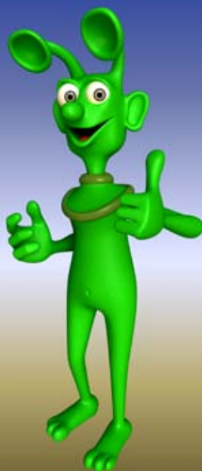
Martánek, klient: Walmark, a.s.