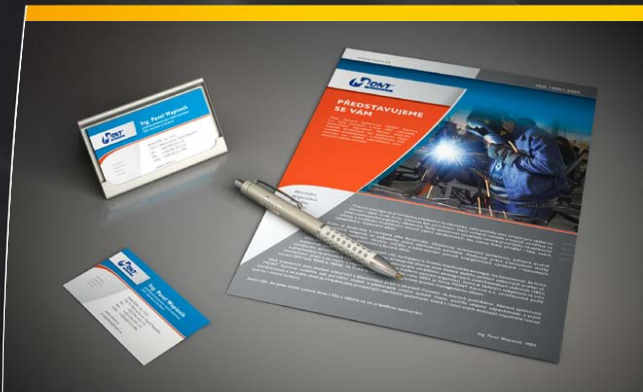
Jednotný vizuální styl MONT, klient: MONT, a.s.