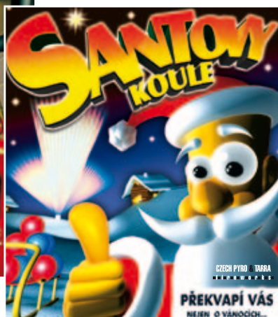
Obaly pro zábavnou pyrotechniku klient: Tarra Pyrotechnic