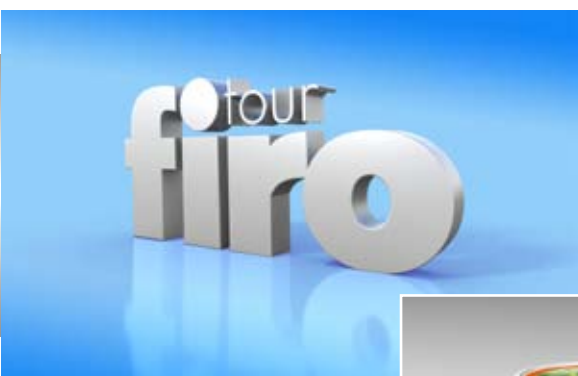
TV Spot Firo Tour klient: Event&Promotion