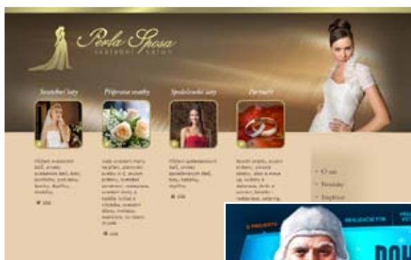
Prezentace svatebního salónu Perla Sposa klient: Perla Sposa