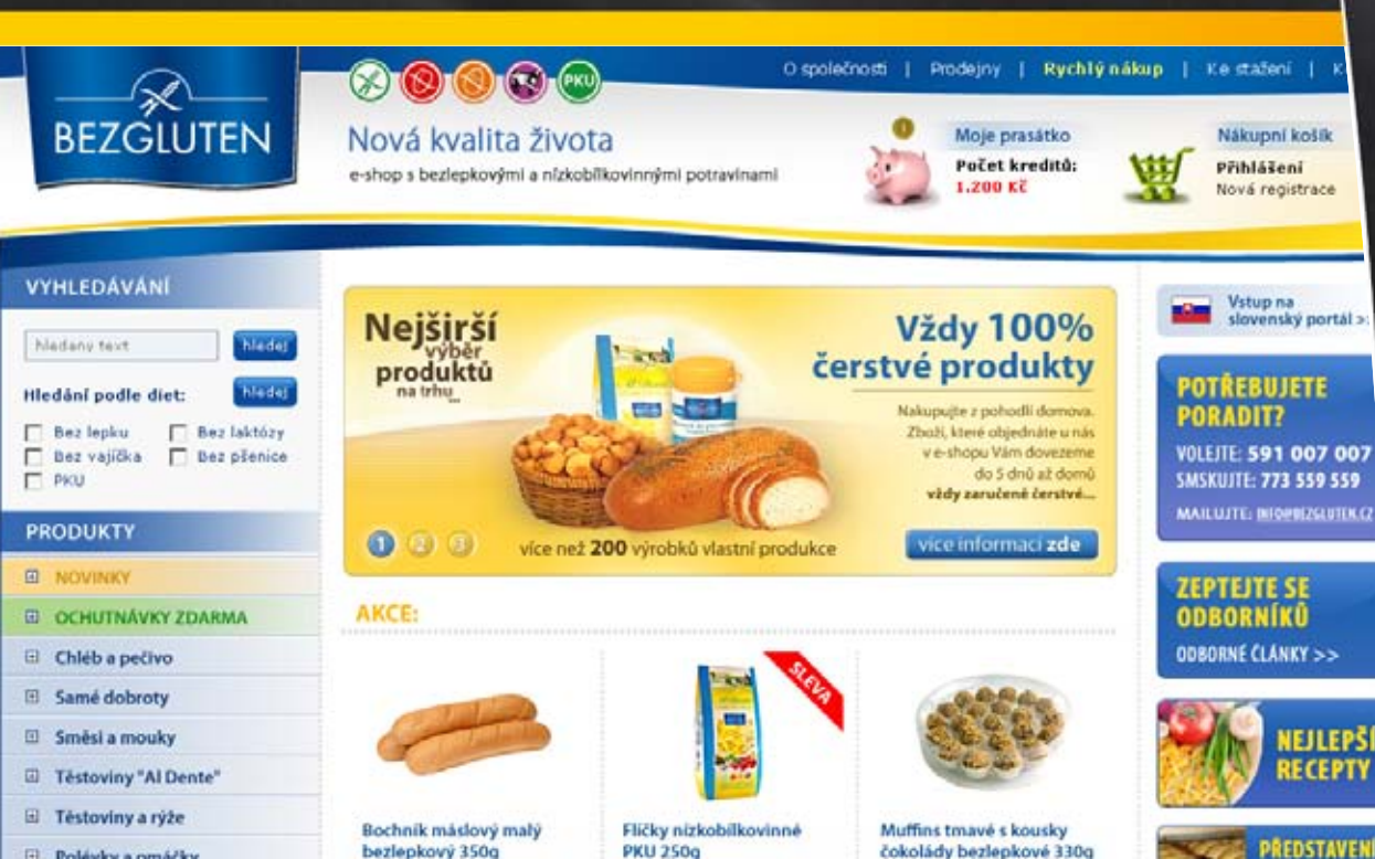
E-shop s bezlepkovými výrobky, klient: Bezgluten Foods, s.r.o.