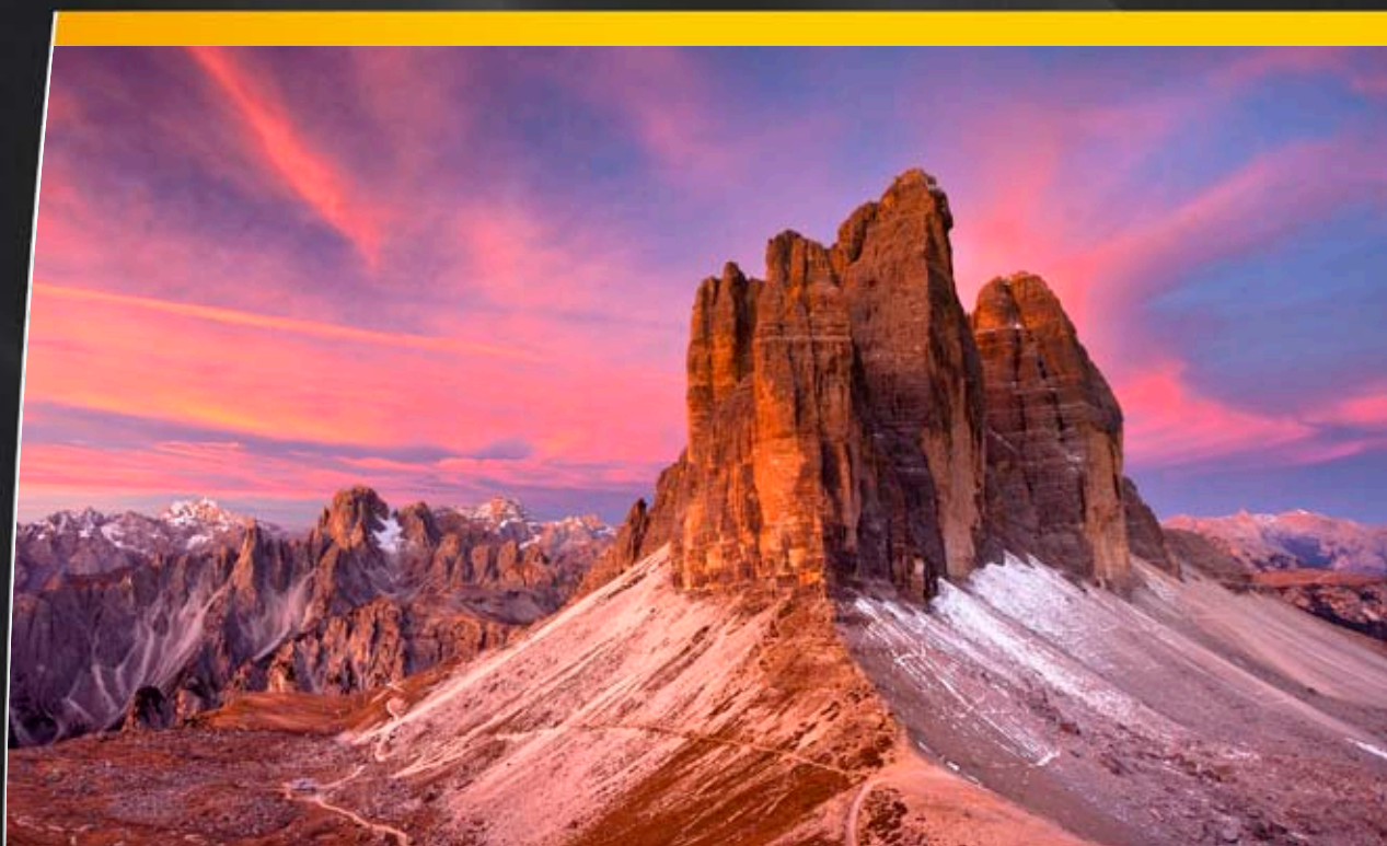
Svitání u Tre Cime - Dolomity, Itálie