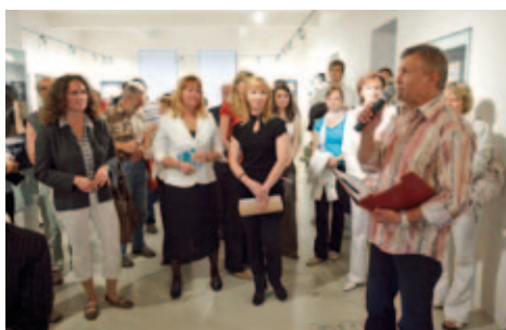
Vernisáž výstavy fotografií