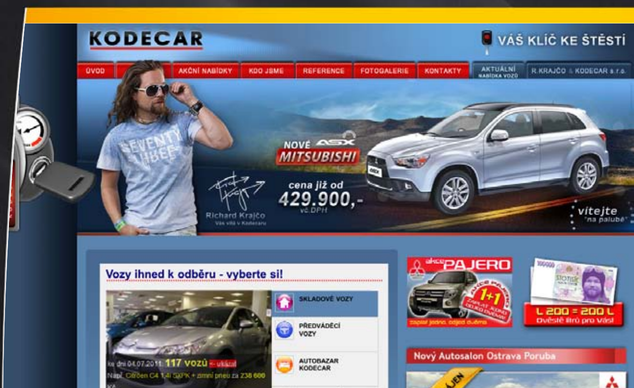
Webová prezentace Kodecar, klient: Kodecar