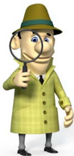
Sting Detektiv klient: RK Sting