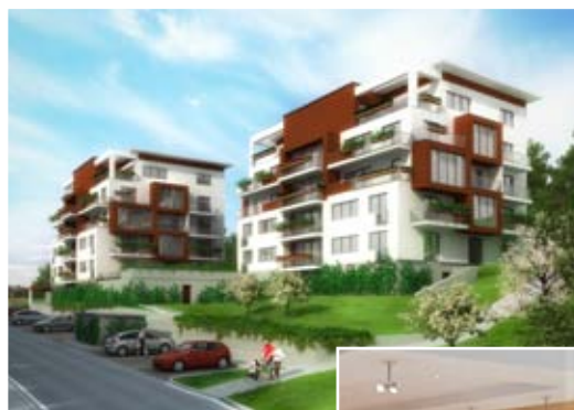
Byty v Parku Ostrava klient: IMOS Development