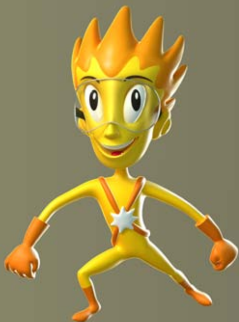
Hvězdičká, klient: Kantors Creative Club