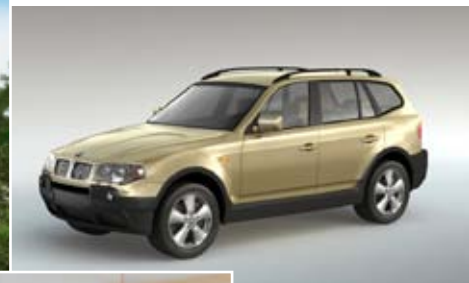
Vizualizace automobilu klient: Direct Services