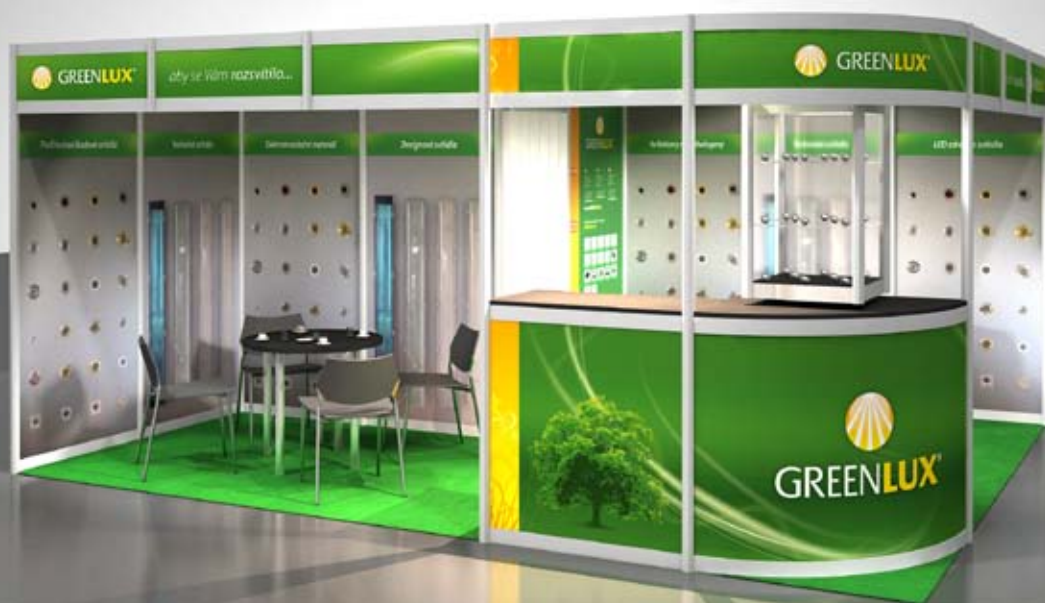
Vizualizace výstavní expozice, klient: Greenlux, s.r.o.