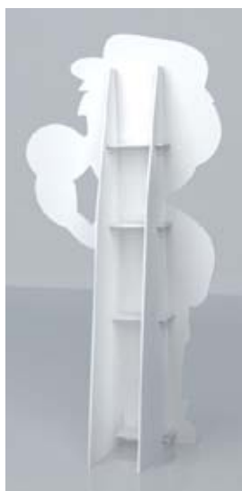
Mr. Green - figurína z PVC klient: Greenlux, s.r.o.