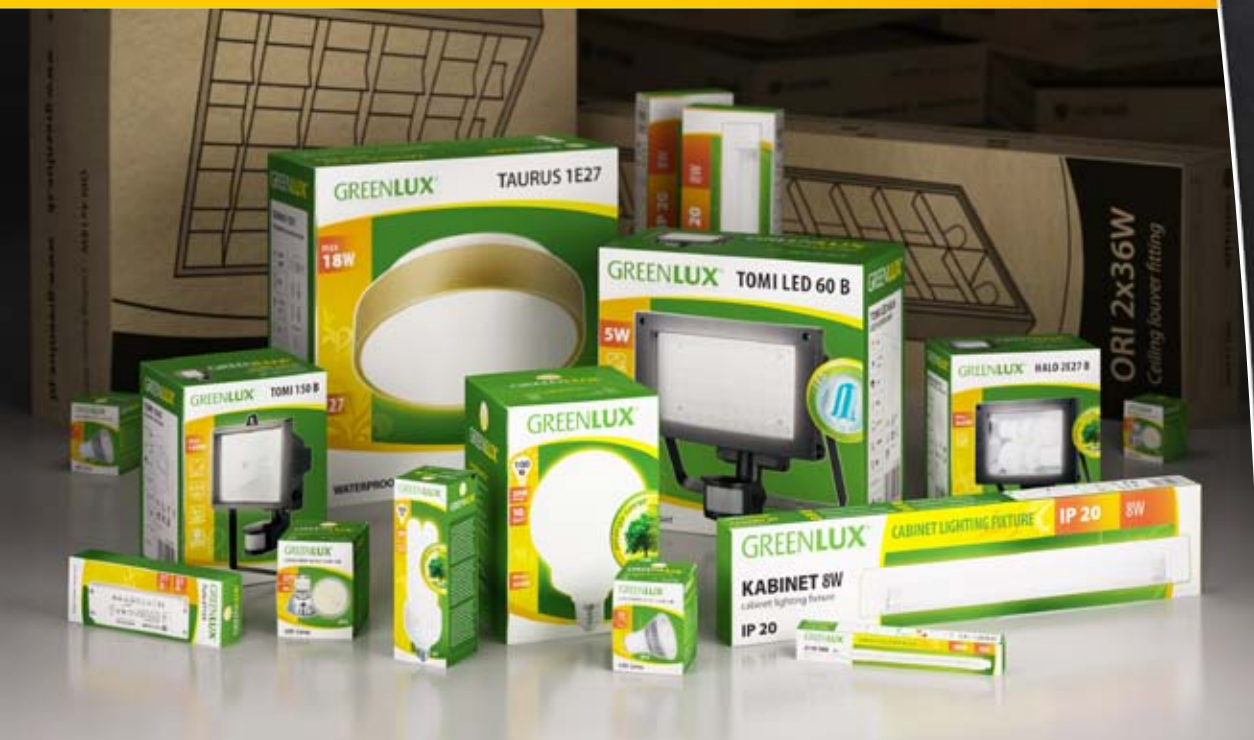
Obaly osvětlovací techniky Greenlux, klient: Greenlux, s.r.o.