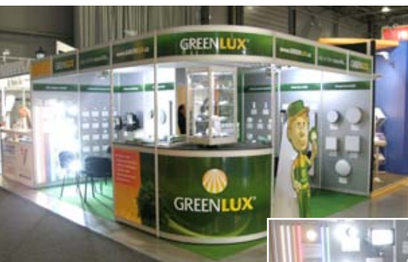
Realizovaná expozice klient: Greenlux, s.r.o.