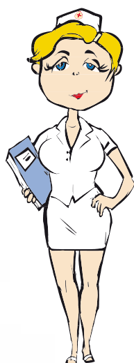
Sestřička klient: FNO