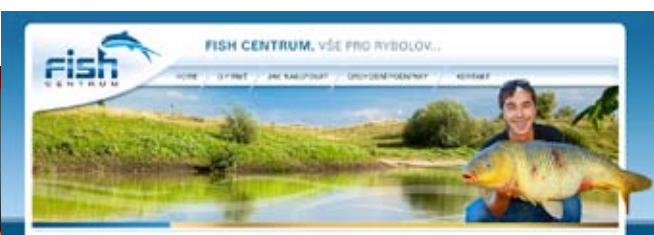
E-shop s outdoorovým vybavením klient: IQ Sport, s.r.o.