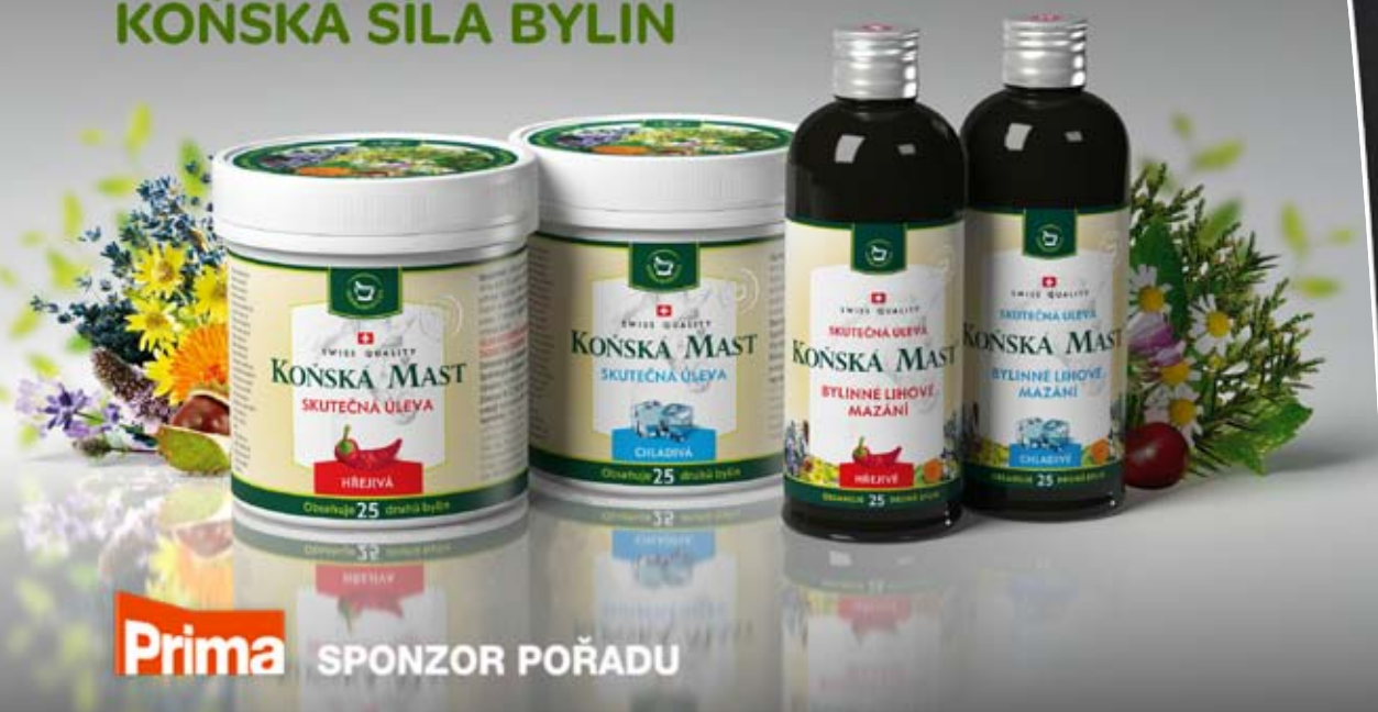
Spot Koňská mast - bylinné mazání, klient: Herbamedicus, s.r.o.