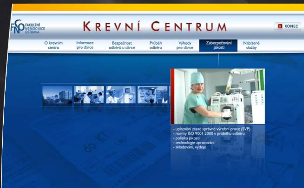
Multimediální prezentace Krevního centra FN Ostrava, klient: FNO