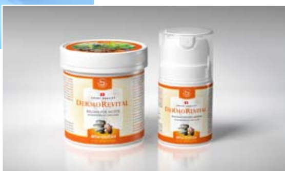
Spot Dermorevital klient: Herbamedicus, s.r.o.