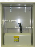
RE 2.0 Z40 xxA P0

Elektromerový rozvádzač trojfázový, jednotarif, pilier so zemným dielom a krytom káblového priestoru s výškou 600 mm (F263), bez možnosti dodatočného doplnenia HDO, hlavný istič od 10A do 63A (doplňuje sa skutočná hodnota menovitého prúdu ističa), resp. vo verzii bez ističa so zaťažiteľnosťou do 32A alebo do 63A—xxA/32, resp. xxA/63, zhotovenie pre oblasť ZSE, SSE, VSE, okienko (W—doplniť do typového označenia). Rozmer: 260 x 1785 mm (Výška nadzemnej časti: 1100 mm)