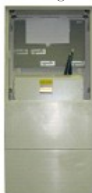
RE 2.0 K40@ xxA P0

Elektromerový rozvádzač trojfázový, jednotarif, zapustený (Z), resp. nástenný (N), s možnosťou dodatočného doplnenia HDO, hlavný istič od 10A do 63A (doplňuje sa skutočná hodnota menovitého prúdu ističa), resp. vo verzii bez ističa so zaťažiteľnosťou do 32A alebo do 63A —xxA/32, resp. xxA/63, zhotovenie pre oblasť ZSE, SSE, VSE, okienko (W—doplniť do typového označenia). Rozmer: 400 x 500 mm