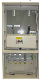
RE 2.0/SPP2 Lug xxA P0