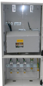
RE 1.0/SPP2 K662 2x xxA P0