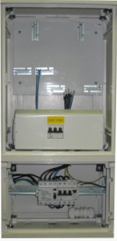
RE 2.0/SZ ZS) xxA P0