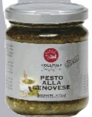
S07 „PESTO ALLA GENOVESE“