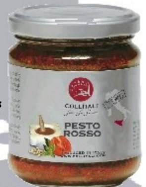
S08 „PESTO ROSSO“