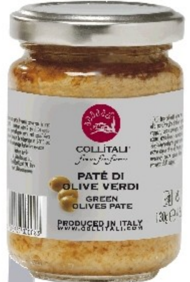
S13- PATÉ ZELENÉ OLIVY