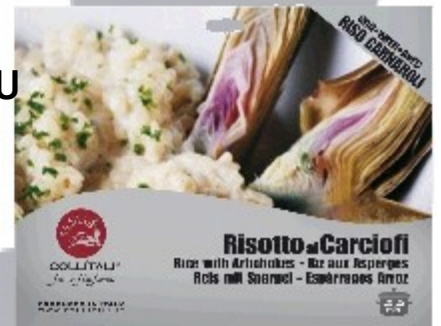
RI02- RIZOTO S ARTIČOKMI