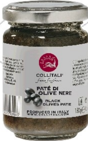
S12- PATÉ ČIERNE OLIVY