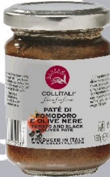
S15- PATÉ PARADAJKY A ČIERNE OLIVY