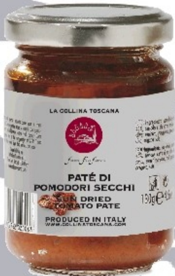
S14- PATÉ SUŠENÉ PARADAJKY