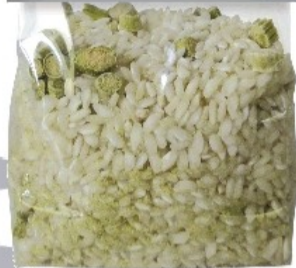
RI02- RIZOTO SO ŠPARGLOU