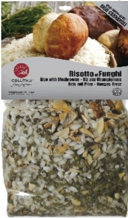
RI01- RIZOTO S HUBAMI