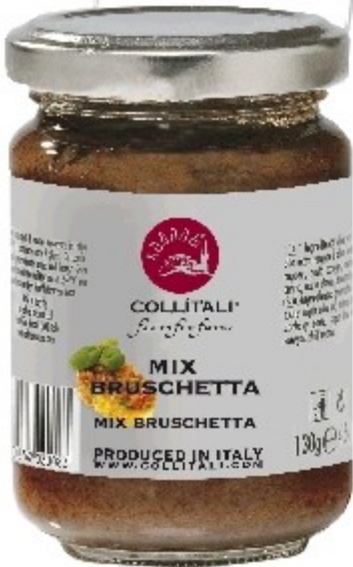
S11- MIX NA TOPINKU