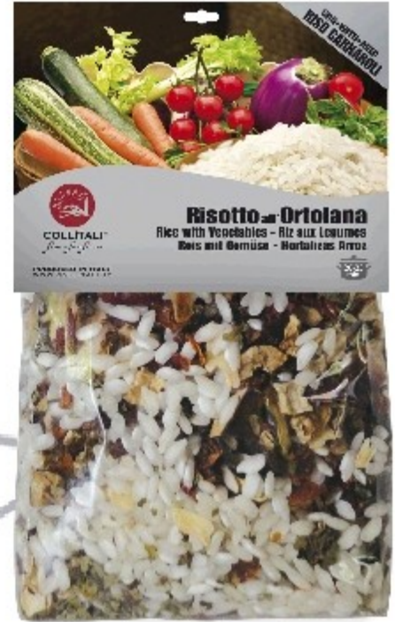
RI02- RIZOTO SO ZELENINOU