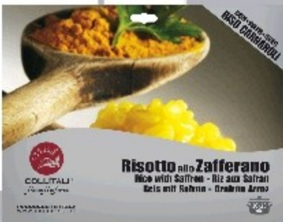
RI02- RIZOTO SO ŠAFRÁNOM