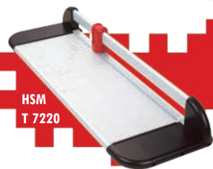
HSM T 7220

Profesionální kotoučové řezačky, řezací kotouč a hrana jsou z tvrdé oceli, kotouč je permanentně osířen, papír je automaticky fixován k podložce. Rám a pracovní deska jsou vyrobeny z hliníku. Tyto řezačky se vyznačují snadnou a bezpečnou obsluhou. Je možné je dovybavit stojanem s pracovní výškou 818 mm.