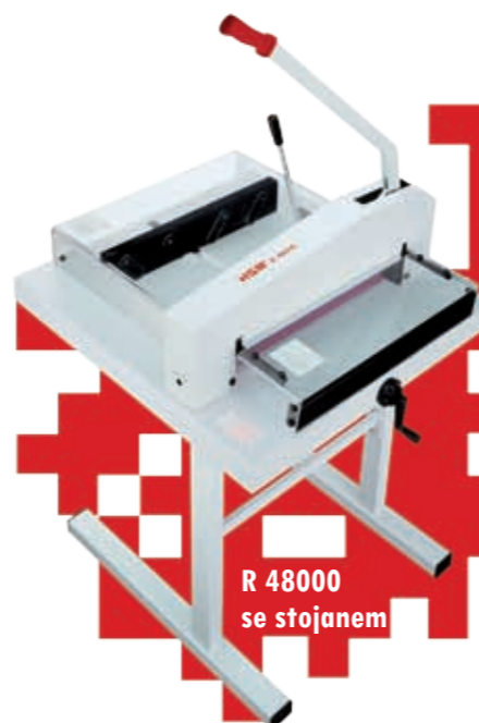
R 48000 se stojanem

Profesionální stroje určené k řezání stohů papírů (kapacita až 500 listů A4 70 g/m 2 ). Jsou vybaveny automatickým lisem k zafixování papíru, průhledným ochranným krytem, na němž je možné zkontrolovat linii řezu, přesným dorazem, rastrem na pracovním pravítku. K tomuto modelu je možné dokoupit stojan.