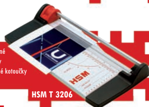
HSM T 3206

Základní jednoduché kotoučové řezačky se snadnou obsluhou, maximální bezpečností práce a nízkou hmotností. Řezací kotouč s permanentním osířením je vyroben z tvrdé oceli, řeže v obou směrech. Rám a pracovní deska jsou z hliníku. Na desce jsou vyznačeny formáty a úhloměr. Papír je během řezání průběžně fixován k podložce. HSM TA 3200 má vyměnitelné řezné kotouče s možností přímého řezu, zvládněného řezu a perforačního nařezání.