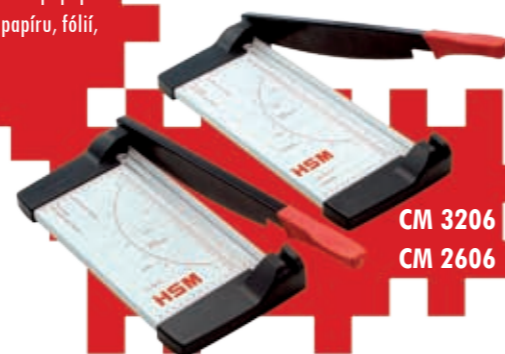
CM 3206 CM 2606