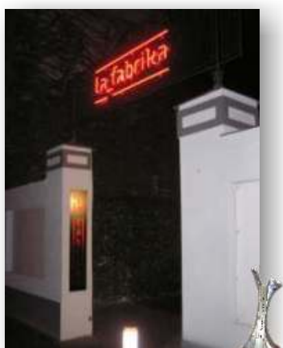
Nominace - umístění na short listu v soutěži "Duhový paprsek 2008" - sekce světelná reklama La Fabrika - označení altern. divadla