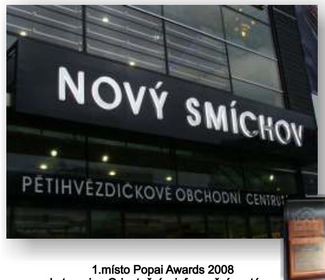
1.místo Popai Awards 2008 kategorie : Orientační a informační systémy Nový Smíchov