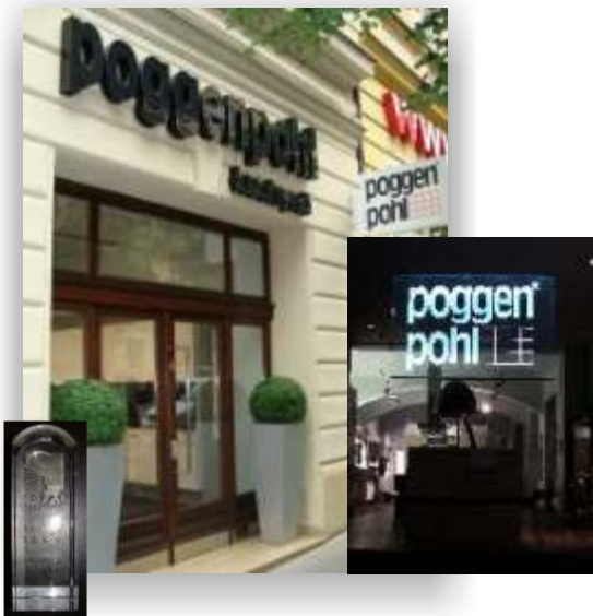
1.místo Popai Awards 2009 kategorie : Orientační a informační systémy Poggenpohň