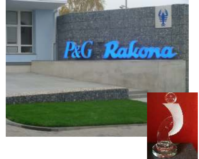
Duhový paprsek 2012 - práce Procter & Gamble - Rakona Vítěz kategorie A - Světelná reklama roku 2011