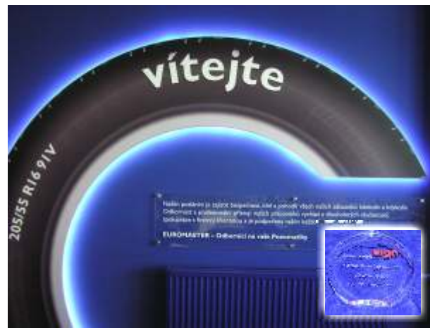
Cena časopisu Sign 2011 a umístění na short listu Duhový paprsek Sekce POP/POS- EUROMASTER