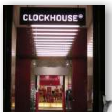
1. místo v soutěži "Duhový paprsek 2003" sekce světelná reklama Označení obchodu Clockhouse Pítkopy