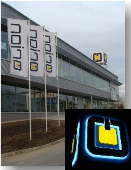
Duhový paprsek 2011 Umístění na short listu Sekce světelná reklama Orion - dům světél