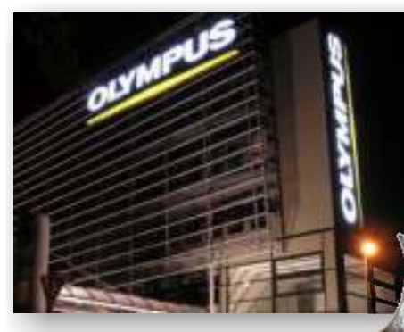
Nominace - umístění na short listu v soutěži "Duhový paprsek 2004" sekce světelná reklama Olympus - označení centrály Praha