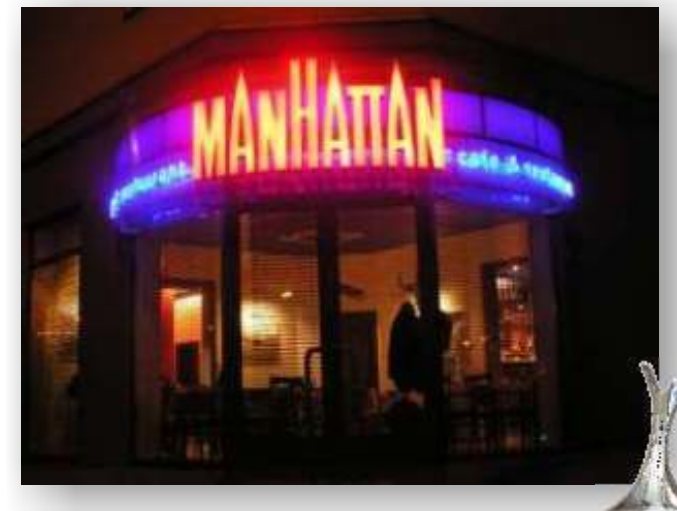
1. místo v soutěži "Duhový paprsek 2006" sekce světelná reklama Manhattan - café restaurant