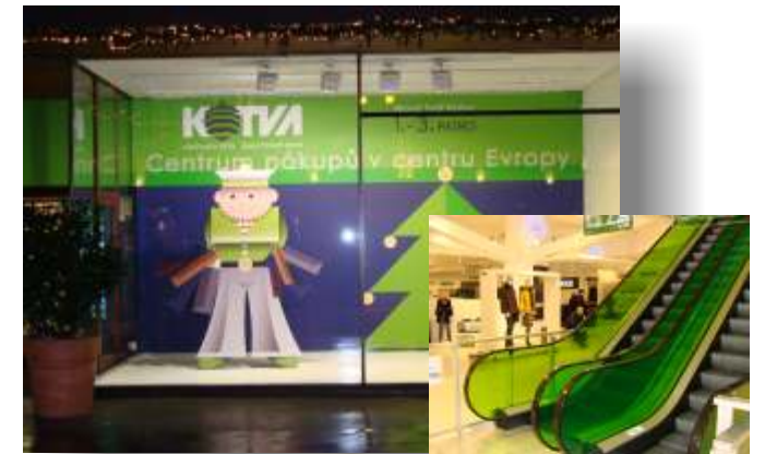
Duhový paprsek 2010 Cena sdružení dodavatelů a umístění na short listu Duhový paprsek Sekce POP/POS- Kotva New Store