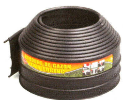
Econo 3000 BKNS