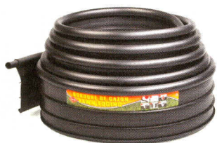
Max 4300 BKNS

BASIC 5200 – délka role 6 m, výška 10 cm, šířka horní hrany 12 mm, barva černá, zelená, cappuccino