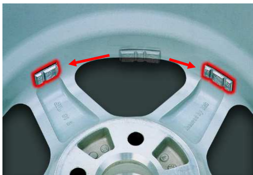
QUICK SPLIT - rychlé rozdělení závaží za paprsky