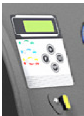
ovládací panel s přehledným 4tyř řádkovým displejem